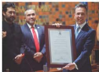
PABLO LEMUS, ayer, en Jalisco.

ELEMECISTA ofrece colaboración a la Presidenta, al arrancar su sexenio; "no seremos un gobierno ni de izquierda ni de derecha, sino de resultados", dice. pág. 5