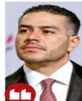
A Horacio "N" se le aseguraron armas largas y droga. Continuamos implementando acciones para reducir los índices de violencia en la región.

Tras una revisión les fueron decomisadas tres armas largas, una