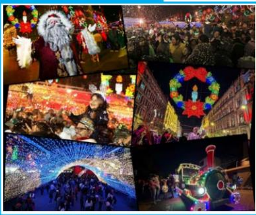
En vísperas de la Navidad, los mexicanos se reúnen en mercados, plazas y eventos culturales. En el Zócalo, el Monumento a la Revolución y espacios emblemáticos, se llevan a cabo verbenas con árboles monumentales, bazares de artesanías y funciones de pastorelas, actividades que estarán disponibles hasta el 6 de enero.

El Financiero (5), Reforma (4), 24 Horas (4), La Jornada (3), El Universal (2), Excélsior (2), El Herald de México (2), El Sol de México (2), ContraRéplica (2), Milenio (1), El Economista (1), La Razón de México (1), y Ovaciones (1).