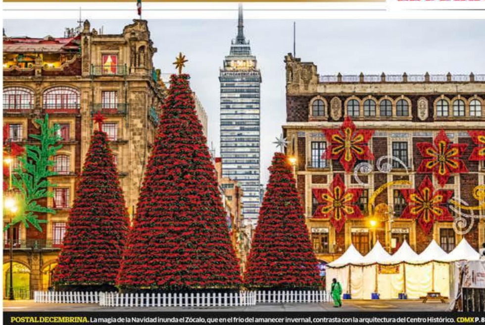
POSTAL DECEMBRINA. La magia de la Navidad inunda el Zócalo, que en el frío del amanecer invernal, contrasta con la arquitectura del Centro Histórico. CDMX P. 8

INFLACIÓN DISMINUYE, PERO LA ACTIVIDAD ECONÓMICA RETROCEDE NEGOCIOS P. 15