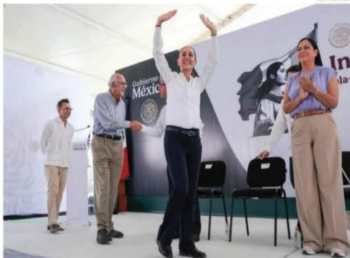
La presidente Claudia Sheinbaum anunció más obras para enlazar Jalisco con Nayarit.

El titular de la SICT informó que para el tramo Jala-Puerto Vallarta se invirtieron dos mil 34 millones de pesos