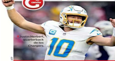
Justin Herbert, quarterback de los Chargers.