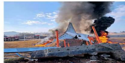
El avión estaba intentando retornar debido a un mal funcionamiento en el tren de aterrizaje.

Era un segundo intento por tomar tierra. El jet se deslizó con el fuselaje sobre la pista sin poder frenar has-