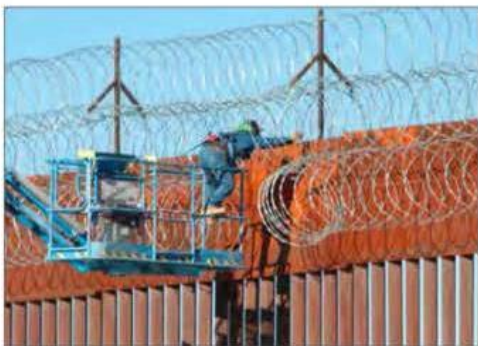
▲ La valla fronteriza entre Ciudad Juárez y El Paso.

JARED LAURELES, ARTURO SÁNCHEZ JIMÉNEZ, ÉDGAR H. CLEMENTE Y ANTONIO HERAS / P.3, 4 Y 18