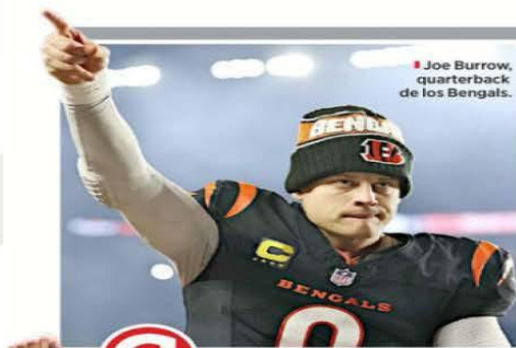
Joe Burrow, quarterback de los Bengals.