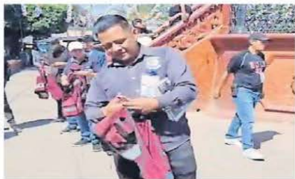
Guías de turistas de Tequila rompieron los chalecos que Rivera los obligó a usar.

El alcalde morenista de Tequila, Jalisco, Diego Rivera Navarro, conformó una red criminal con varios funcionarios para extorsionar, secuestrar, torturar y amedrentar a comerciantes, artesanos, empresarios del ramo tequilero y hasta a los adversarios políticos de su mismo partido para quitarlos del camino. ● Estados A9