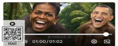
■ El video fue retirado de la red social de Trump tras el escándalo.